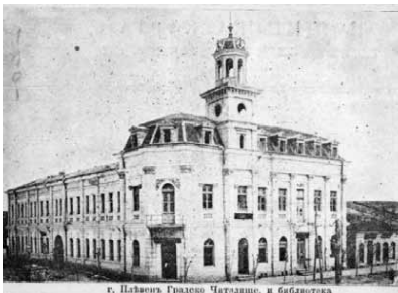
г. Пловдивъ Градско Читалище. и библиотека