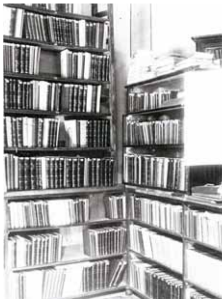
Градското читалище и библиотека в края на XIX и началото на XX в.