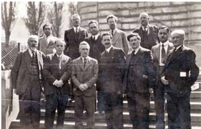
Членовете на Управителния съвет на Върховния читалищен съюз, Плевен, 30 април 1934 г.