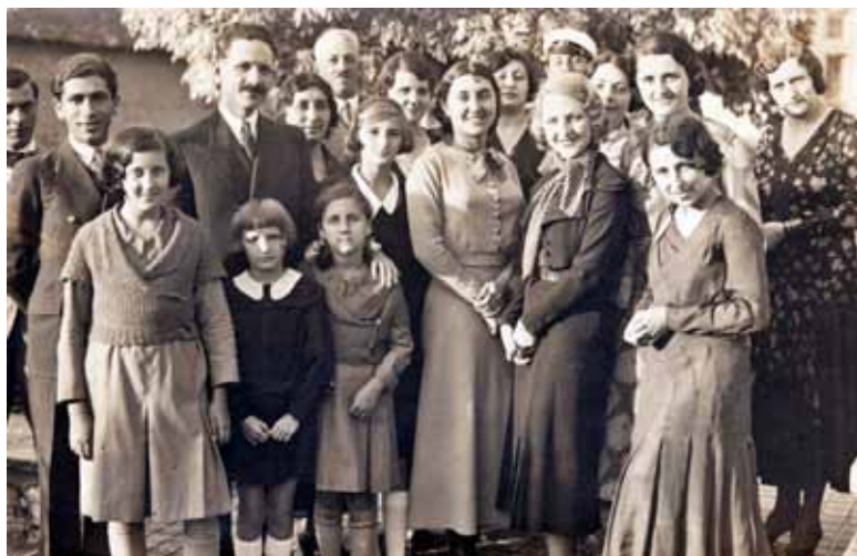
Ячо Хлебаров с немската киноактриса Евелина Холт и нейни почитатели при гостуването ѝ в Плевен, 1933 г.