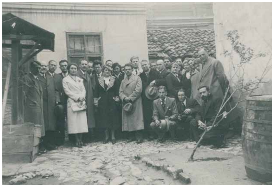
Ячо Хлебаров след конгреса на провинциалните писатели, Плевен, април 1937 г.