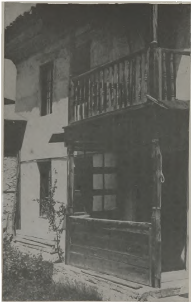
Къщата на Везюви в Банско, където в стаята на горния етаж, вляво, се ражда Н. Вапцаров