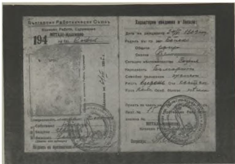
Членска карта на Н. Вапцаров от Българския работнически съюз, издадена в София през 1936 г.