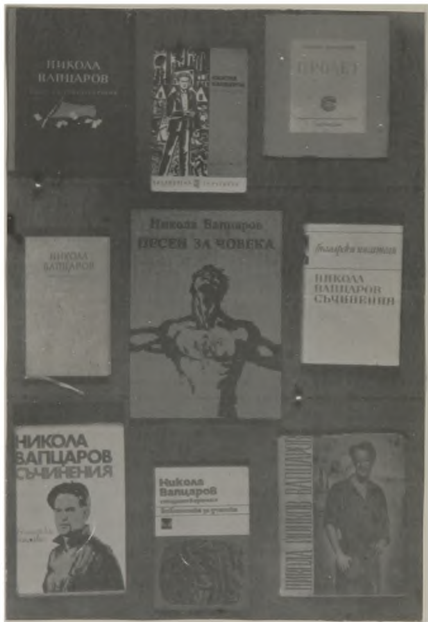
Издания на Вапцаровите стихотворения