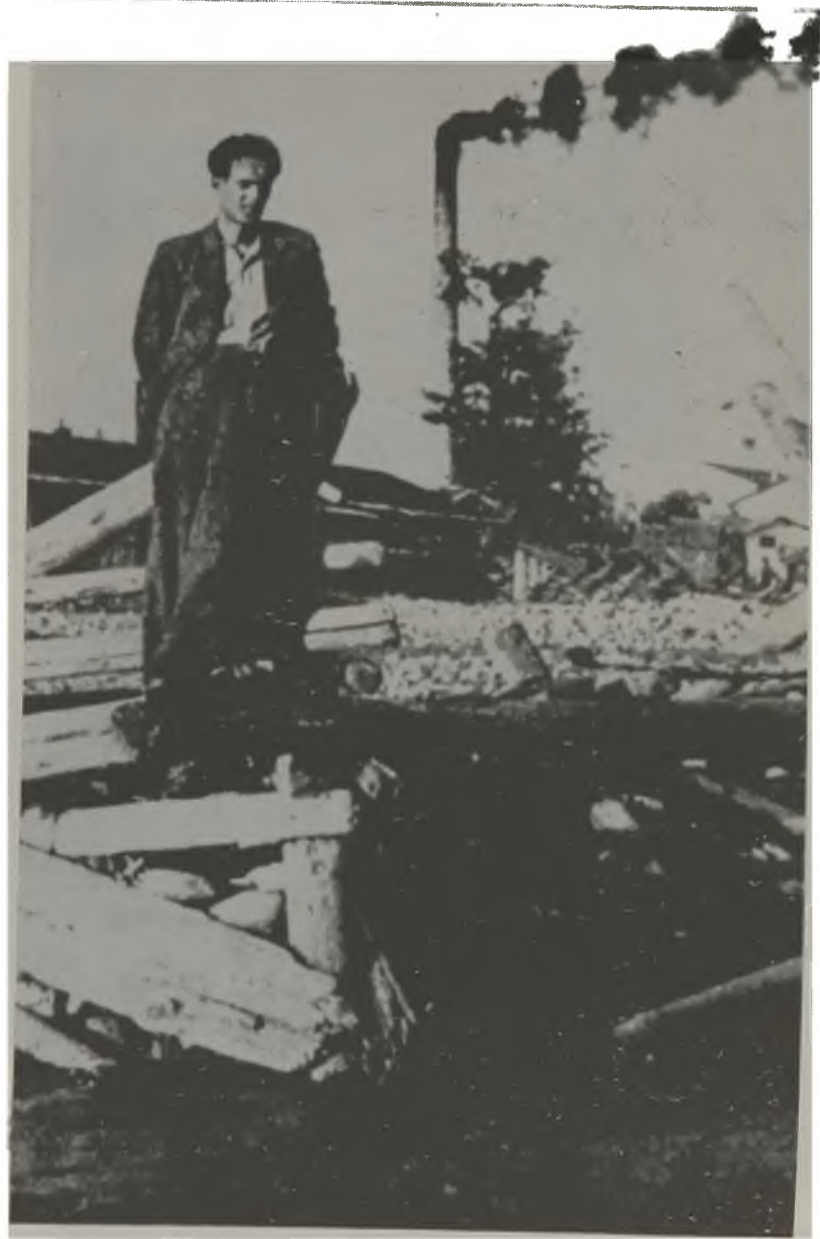
Н. Вапцаров в с. Кочериново през 1933 г.