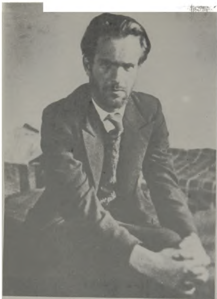
Н. Вапцаров в с. Кочериново през 1933 г.