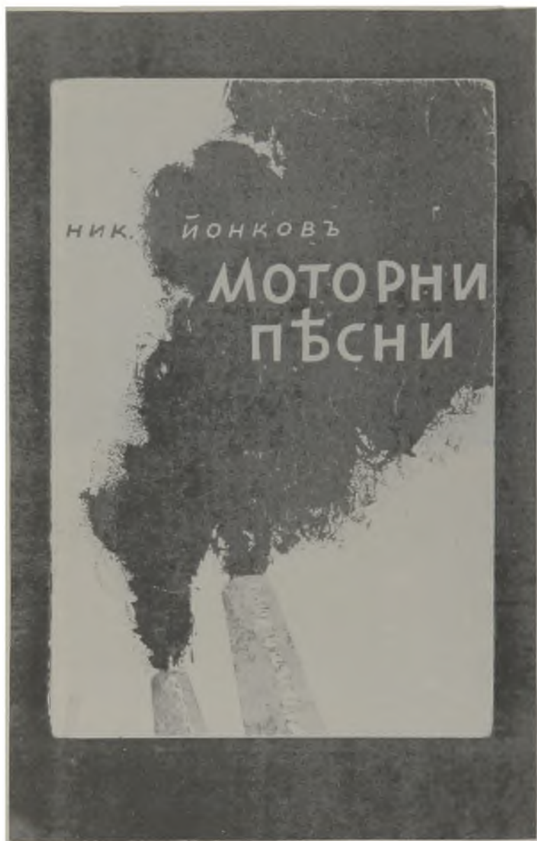
Корицата на първото издание на книгата «Моторни песни» през 1940 г., нарисувана от Б. Ангелушев