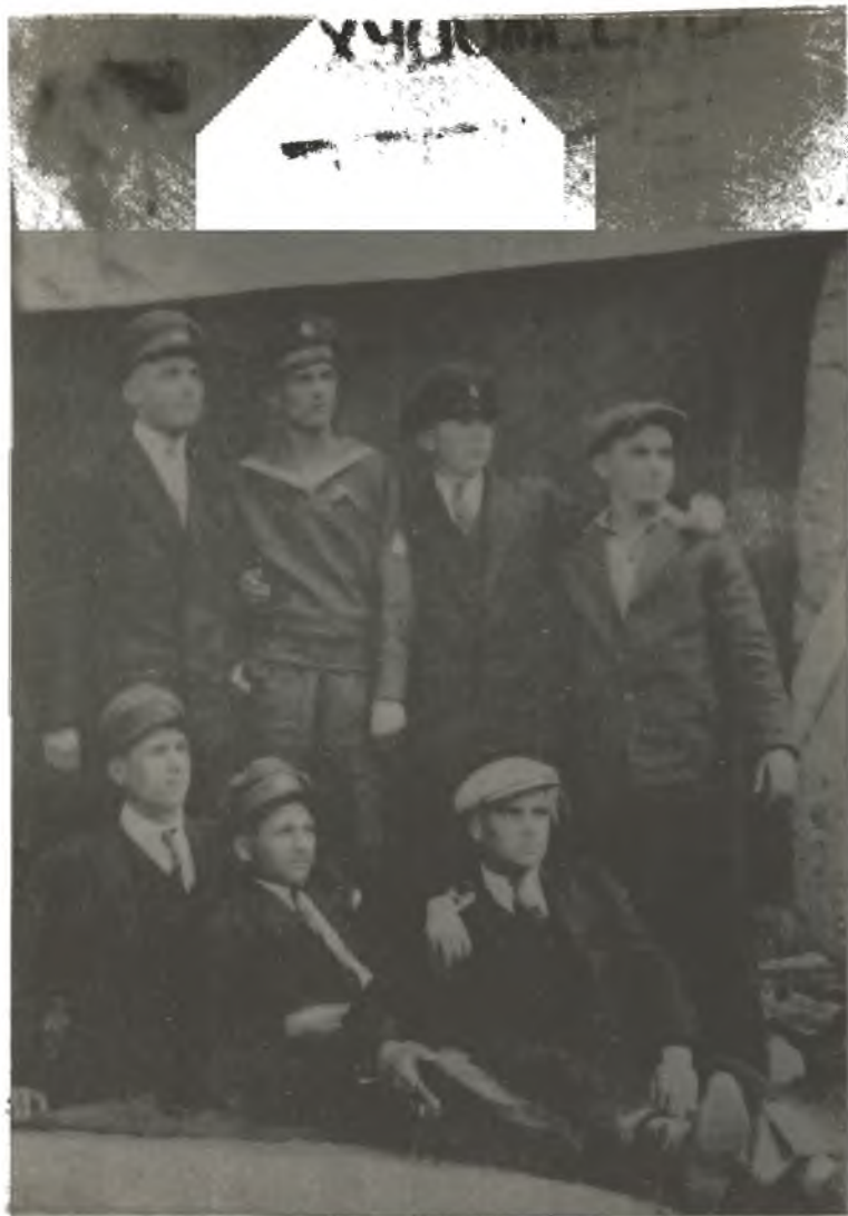
Никола Вапцаров със свои другари от Банско през една от ваканциите 1927—1928 г.