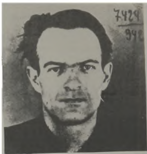
Последната снимка на поета, направена през март 1942 г. в Дирекцията на полицията