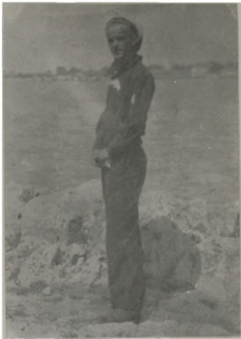
Моряка на черноморския бряг, 1929 г.