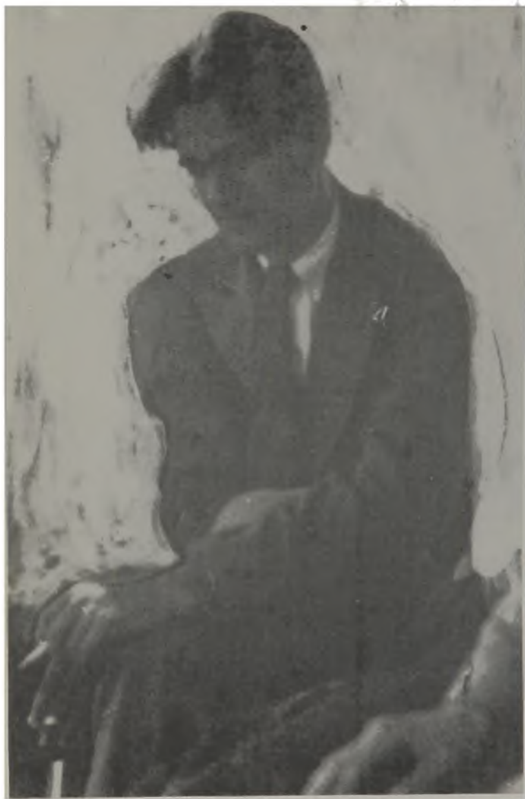
Една от най-изразителните снимки на поета от 1932 г.