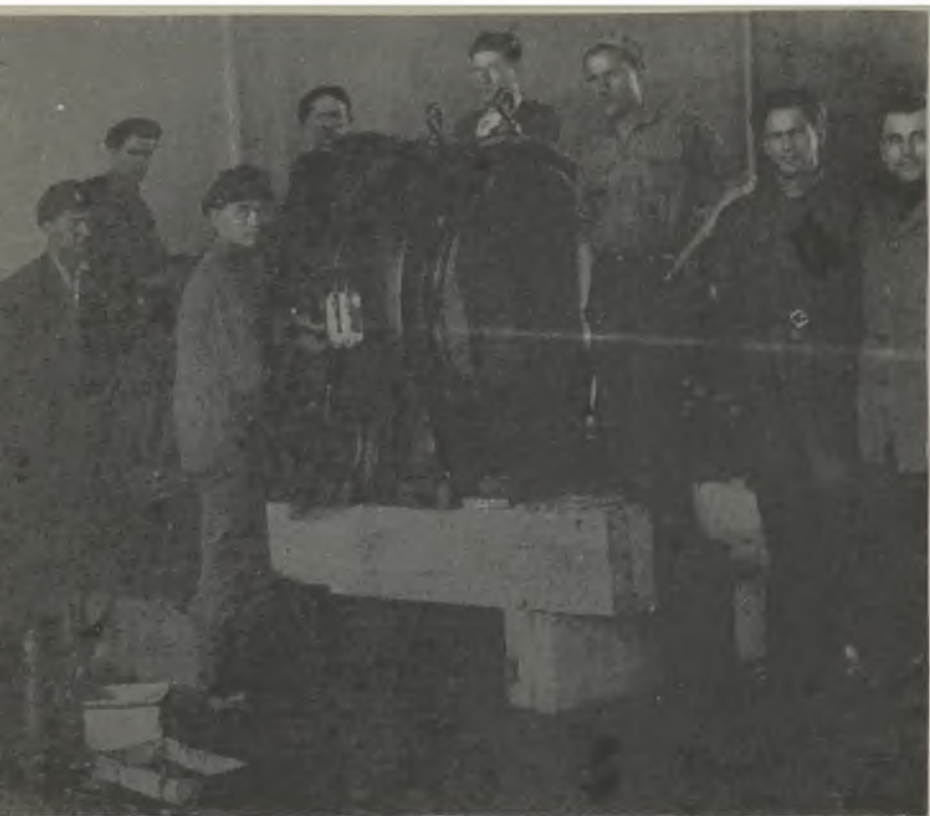
Н. Вапцаров с група работници от книжно-мукавената фабрика в с. Кочериново през 1933 г.